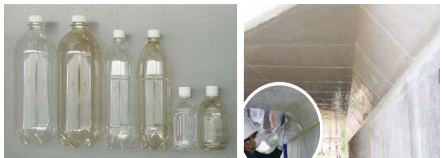
図-1 DLC コーティングした PET ボトル（それぞれ左側が通常のボトルで右側がコーティングされたボトル）ならびに DLC シートを貼り付けたコンクリート構造物の例（積水化学パンフレットより）

耐摩耗性、低摩擦性、耐食性、ガスバリア性、人体への無害性等の長所を有する DLC 薄膜技術の適用例や大気圧で DLC 薄膜を合成する技術等が紹介された。気体の透過を遮断するため、一部のペットボトルの内面には DLC 薄膜がコーティングされていることや、高架橋等のコンクリート構造物の耐久性向上を目的として、構造物表面に DLC シート（DLC 薄膜を平面シート上にコーティングしたもの）の貼り付けが試験的に行われていることが紹介された（図-1）。